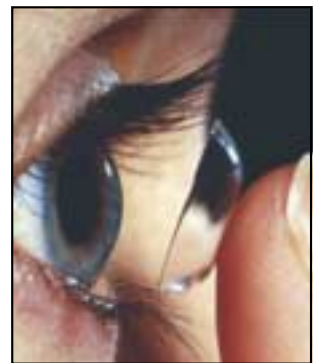
العدسات اللاصقة اللينة .. قابلة للإثناء وسهلة النها لا تصحح إلا درجة واحدة من الاستجماتيزم